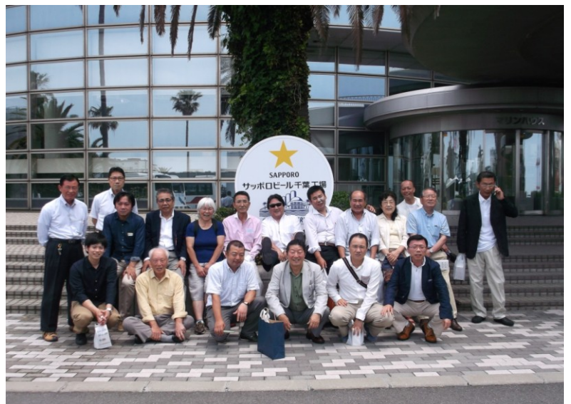
サッポロビール千葉工場を見学した組合研修旅行

毎年恒例の組合研修旅行は、今回は六月十三日(土)、十四日(日)の一泊二日で開催されました。 十三日の午前九時半にバスで上野から出発し、見学先の千葉県船橋市にある「サッポロビール千葉工場」に向かい、十一時より工場見学をしました。 千葉工場はサッポロビールの主力商品である「サッポロ黒ラベル」を生産して